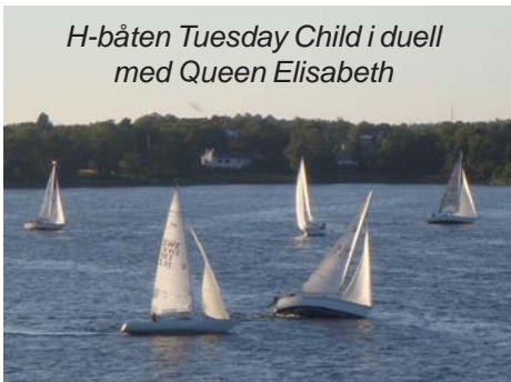
H-båten Tuesday Child i duell med Queen Elisabeth

Det är egentligen obeskrivligt bra – att komma ner till bryggan mitt i veckan och det är full syssel-sättning vid båtarna. Alla kan varandras namn och det ges tips och pikas lite. Barn, vuxna, farfar, arbetskamrater och kompisar.