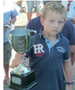
Aston med pokalen

ensamma. Kanske är en snitttid på ca 3 timmar något att eftersträva så att vi också hinner basta lite.