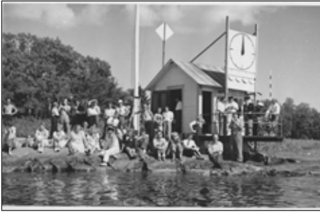
Att den tidens regattor var populära vittnar detta foto från 1942 om!