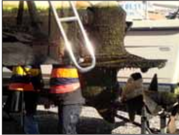
Denna ständiga påväxt...

och en konsekvens av att vi behandlar våra båtar med gifter för att just döda mikroorganismerna och därmed förhindra påväxt på skrovet.