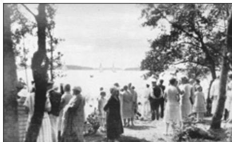
Åskådare och utsikt över kappseglingsbanan 1926