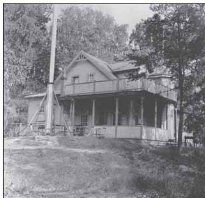
Klubbhuset 1940 - viss skillnad mot vår restaurang i dag!.

Klubbhuset, troligen byggt av den tidigare ägaren redan runt 1900, var slitet och otidsenligt. 1949 hade medlemmar tvättat och målat huset men 1966 beslutade klubben om en grundlig ombyggnad, för att ge medlemmarna