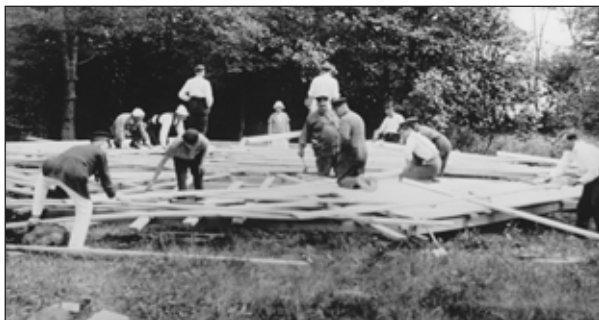
Dansbane- bygge anno 1926