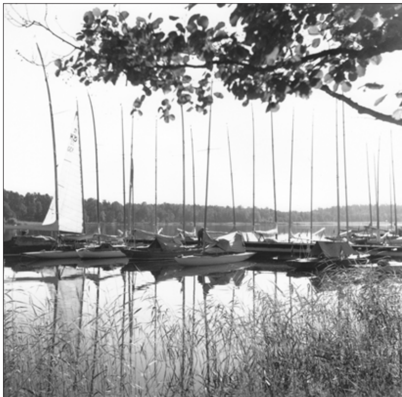
Småbåtshamnen på Getfoten 1942